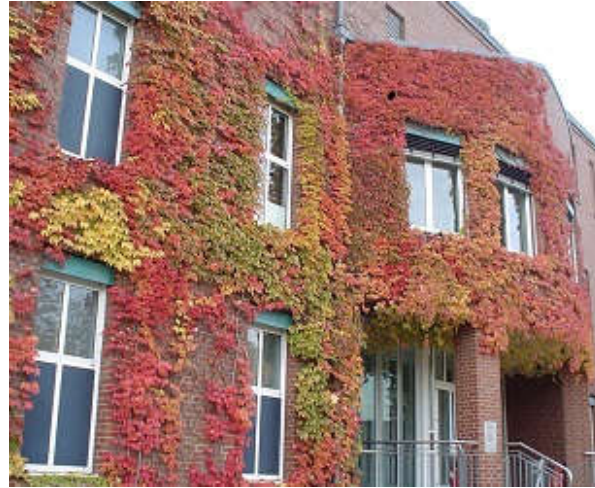
Fachschulgebäude der Wilhelm – Ostwald – Schule

(z.B. Maler/in- und Lackierer/in, Fahrzeuglackierer/in, Verfahrensmechaniker/in für Beschichtungstechnik, Gestaltungstechnische/r Assistent/in, Schilder- und Lichtreklamehersteller/in, Raumausstatter/in)