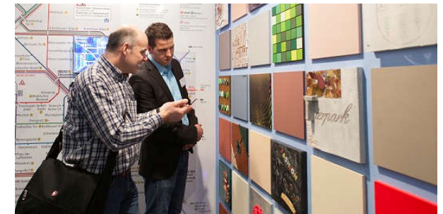
2013: Studierender der Fachschule erläutert das Messekonzept „Farbort Berlin“ auf der Messe „Farbe – Ausbau und Fassade“ in Köln